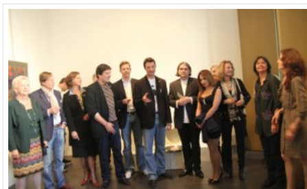
По време изложбата International ART connection - AGORA в БКИ Дом „Витгенщайн“ през април 2011 г.